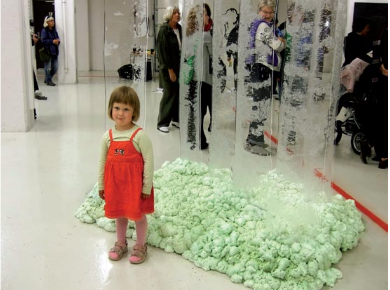
Skog, 2008, foto på pleksiglass og byggeskum. Verket endrer form fra hvert utstillingssted, her fra Trøndelagsutstillingen 2009 i Trondheim.

retning. Selv om tunge aktører som Snøhetta la inn forslag, var det igjen Dyrnes som vant, denne gang sammen med Arild Juul.